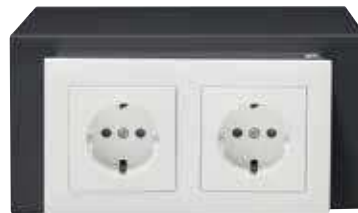
SUKO Ref. 23100W-S0