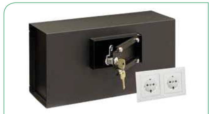
Dispone de capacidad para guardar pequeños objetos de valor.