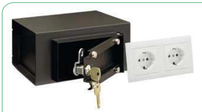
Retirando la placa de enchufes se accede a la cerradura de la caja