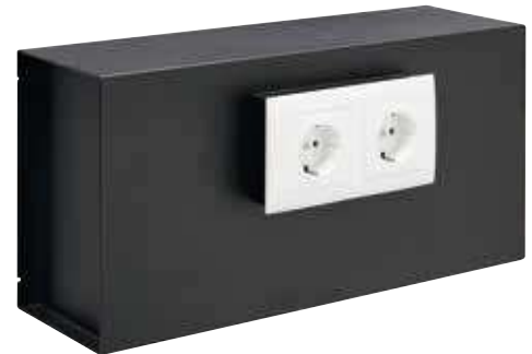
SUKO Ref. 23100W-S1