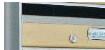
Moldura en plata.