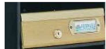
Moldura en oro.