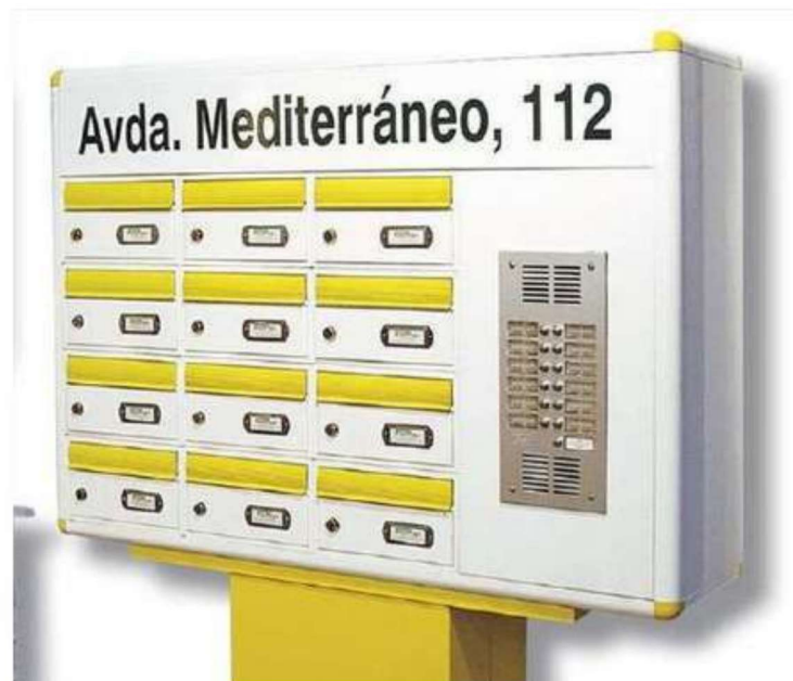
Centralización Mod. Urban con rotulación e interfono