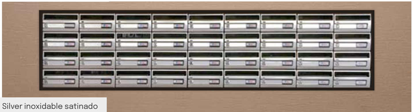
Silver inoxidable satinado