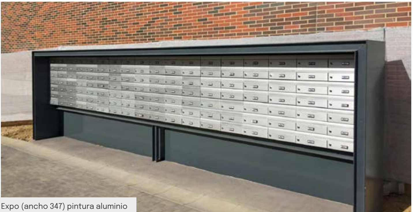
Expo (ancho 347) pintura aluminio