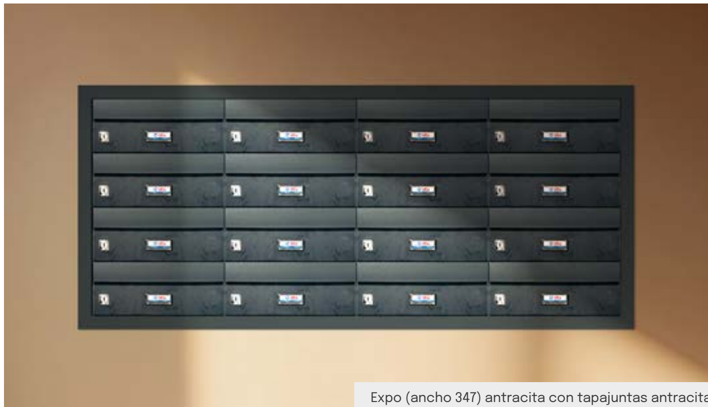
Expo (ancho 347) antracita con tapajuntas antracita